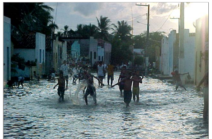
Gennaio 2004: Nonostante l'esondazione del Rio São Francisco , i bambini fanno festa nelle strade allagate; ma occorre sistemare una 50ina di famiglie alluvionate ...