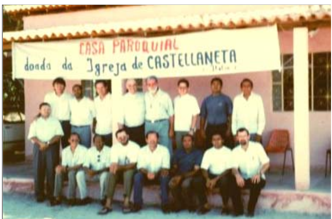
15 ottobre 1996: Inaugurazione della nuova Casa Parrocchiale (nel 2008 si è poi trasferito in prossimità della casa delle suore e della Chiesa)