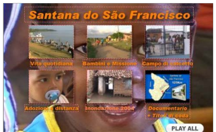
Novembre 2006: DVD Santana do São Francisco