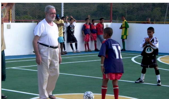
Natale 2005: Inaugurazione del campo di calcetto parrocchiale (poi ampliato in spazio coperto polifunzionale, con un cospicuo contributo della nostra Associazione e delle offerte per il libro " Tessitori di Speranza ")